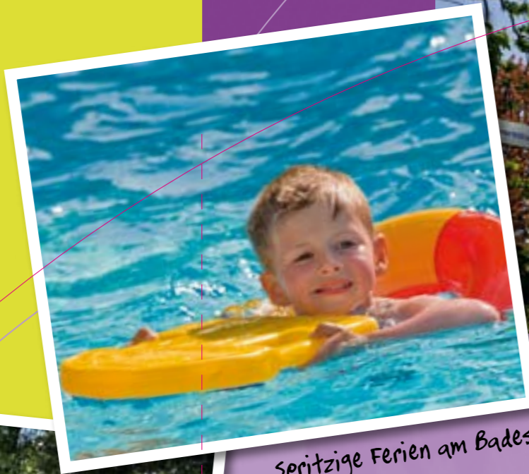
Spritzige Ferien am Badeseel!