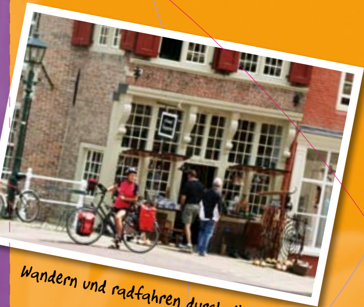
Wandern und radfahren durch die historische Stadt.